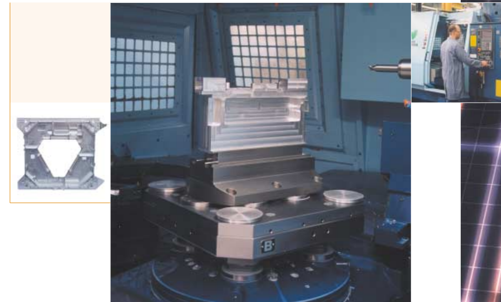
Matsuura MAM-700HG-machine voor horizontaal frezen.

Producten worden hier getest op hun specificaties in de verschillende stadia van het productieproces. Nauwkeurige controle betekent een garantie voor de kwaliteit die Wilting voorschrijft.