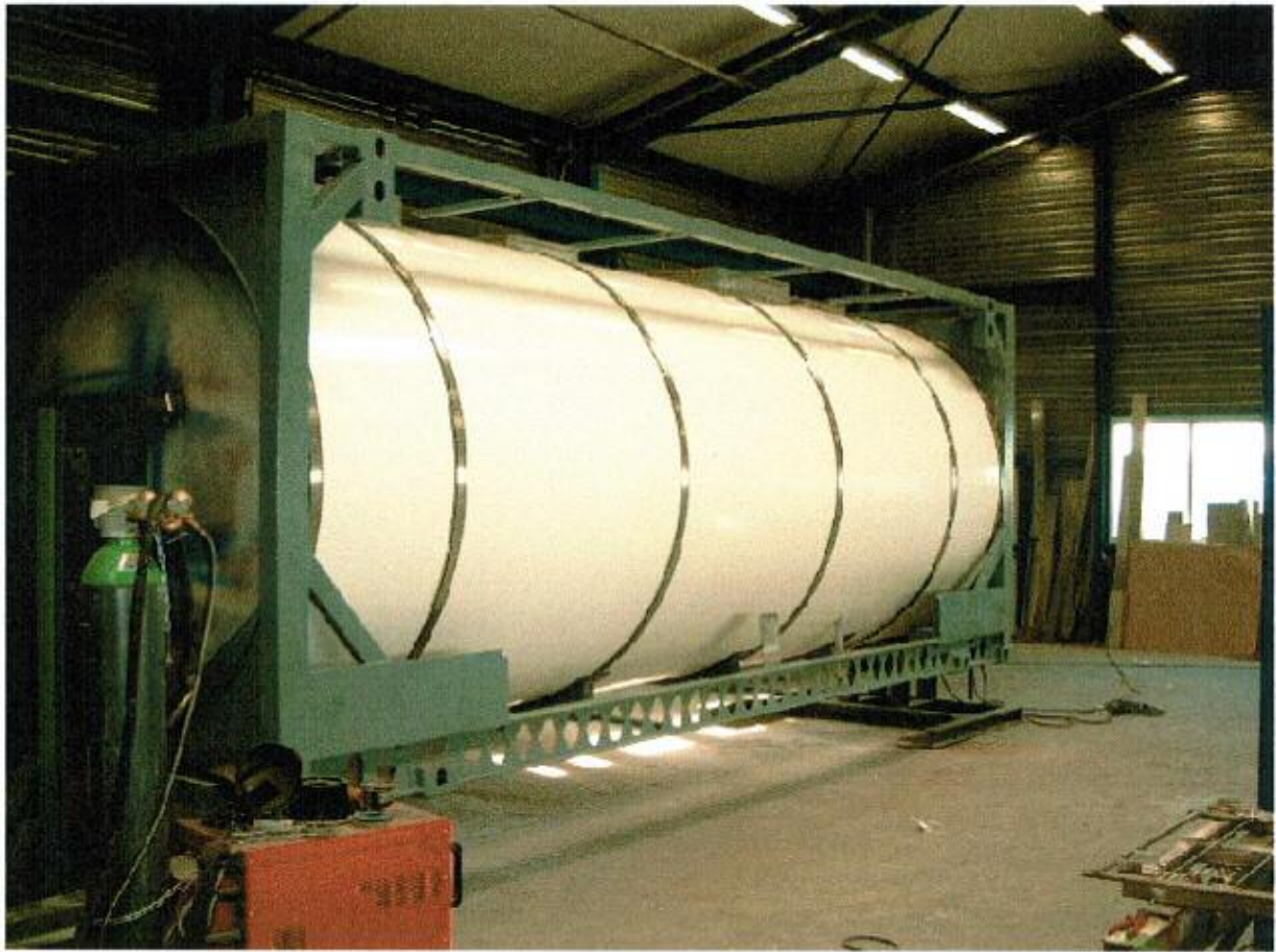
Bekleden van RVS tank